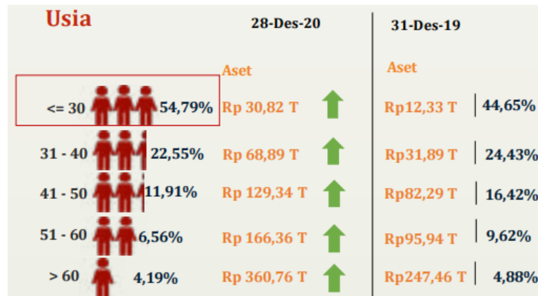
Gambar 1.1 Demografi Investor - Usia (31 Desember 2019- 2020)