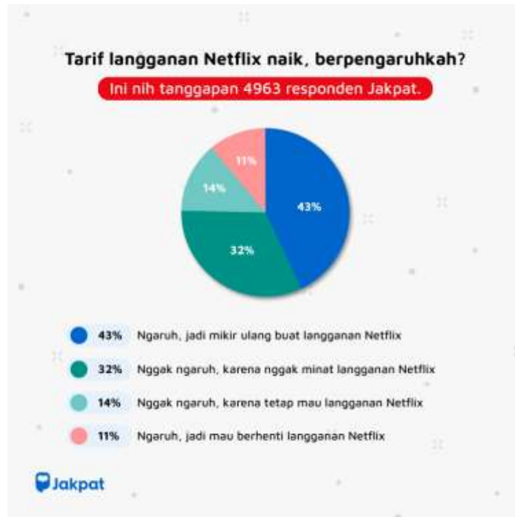
Gambar 1. 2. Hasil Survey Terkait Kenaikan Tarif Netflix

Menjamurnya penyedia layanan VOD di Indonesia membuat persaingan yang semakin ketat dalam memenuhi kebutuhan pelanggan.