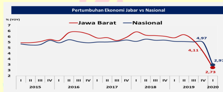
Gambar 1. 2 Laju Pertumbuhan Ekonomim Jawa Barat Menurut Bank Indonesia 2015-2020