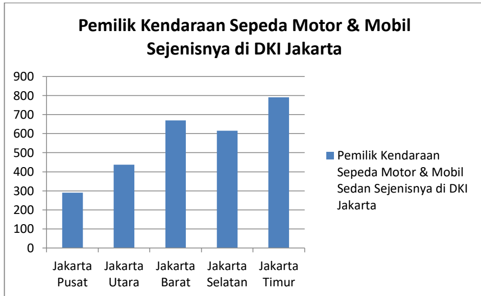
Grafik 1. 2 Data Pemilik Kendaraan Bermotor di DKI Jakarta Tahun 2020