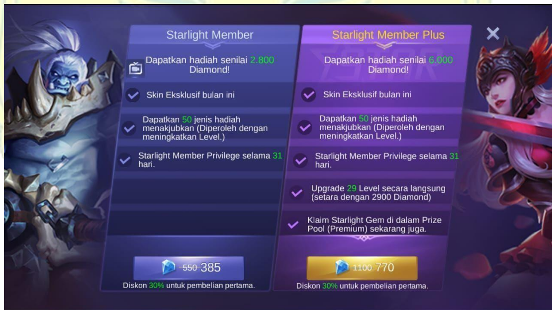
Gambar 1.5 Perbedaan keuntungan Starlight Membership

sendiri terbagi menjadi dua tipe yakni Starlight Member dan Starlight Member Plus yang memiliki perbedaan keuntungan. Perbedaan keuntungan tersebut terletak pada jumlah diamond yang didapatkan dan level yang didapatkan pada saat membeli membership tersebut. Starlight Member Plus memberikan sejumlah 3200 lebih banyak diamond dibandingkan Starlight Member . Tidak hanya diamond , pemain juga mendapatkan 29 level sehingga pemain dapat mendapatkan 30 hadiah pertama tepat disaat pengguna membelinya.