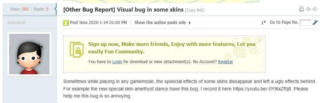
Gambar 1.7 Keluhan mengenai kualitas visual karakter

tampilan skin karakter yang mendapatkan banyak laporan kecacatan atau bug . Kualitas tampilan skin merupakan salah satu faktor penentu yang menentukan apakah pemain akan membeli skin atau tidak. Pada saat fitur skin tersebut dilaporkan memiliki bug , tentunya akan mempengaruhi niat beli pemain akan skin tersebut. Pemain akan enggan untuk membeli skin yang memiliki banyak laporan kecacatan karena nilai keindahan visual dari karakter tersebut akan berkurang. Kualitas visual penting karena berhubungan dengan tiga aspek niat beli barang yakni kualitas fungsional, nilai estetika, dan nilai kenikmatan. Kualitas fungsional membahas tentang performa item yang bebas dari bug sehingga barang tersebut bekerja sesuai dengan harapan konsumen. Nilai estetika berhubungan dengan nilai keindahan yang menarik di mata konsumen. Sedangkan nilai kenikmatan memiliki hubungan yang erat dalam merangsang imajinasi pemain terhadap game yang dimainkan. Kualitas tampilan karakter yang tidak sesuai dengan ekspektasi dapat mengganggu kenikmatan pemain dalam bermain game .