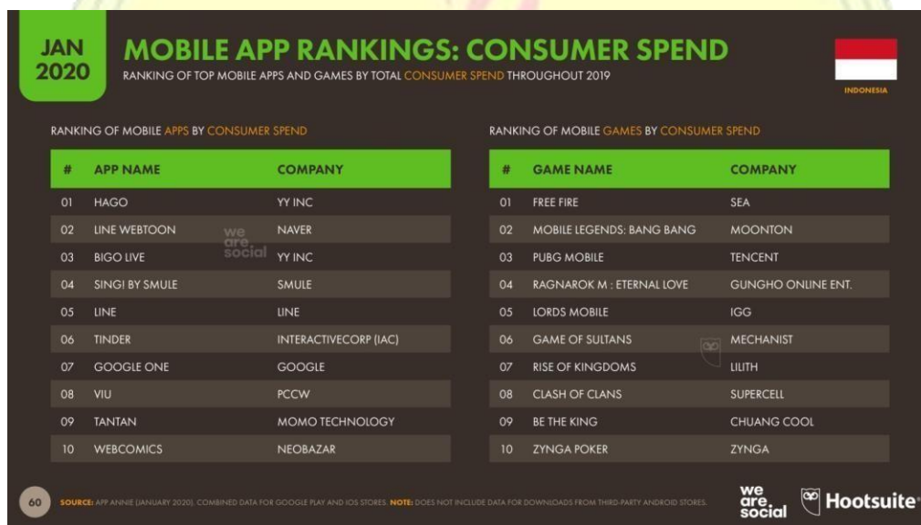
Gambar 1.2 Mobile App Rankings: Consumer Spend

dapat mempengaruhi keseimbangan (menang-kalah) permainan, yang dalam hal ini adalah emblem fragment . Sedangkan barang dekoratif adalah barang yang digunakan untuk mengubah penampilan karakter yang tidak mempengaruhi keseimbangan permainan, yang dalam hal ini adalah skin karakter hero yang digunakan pemain.