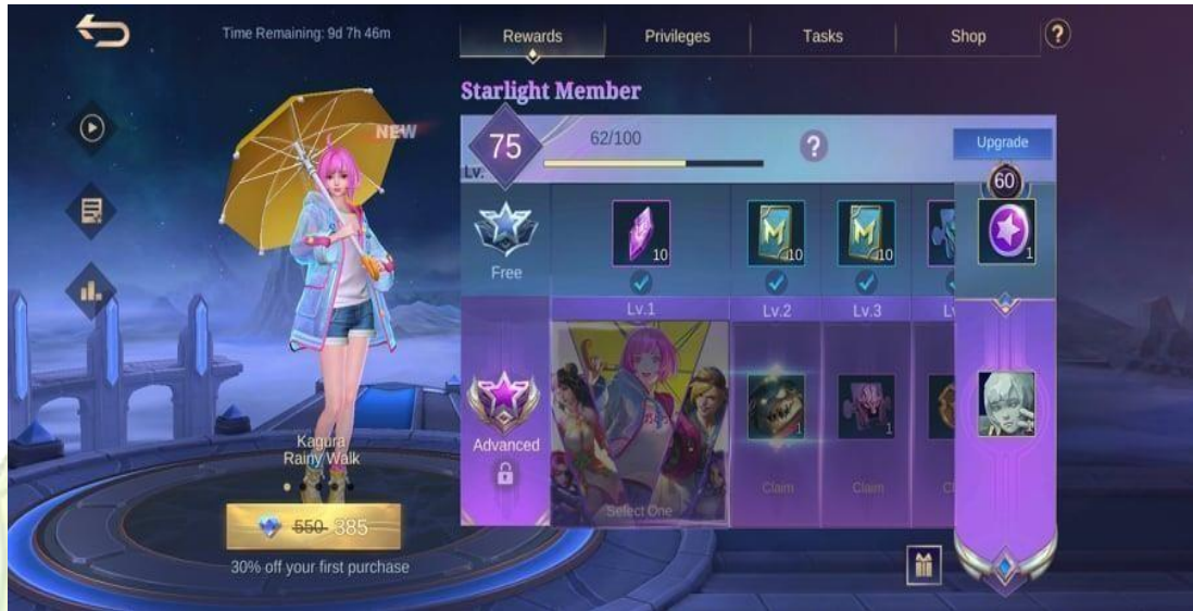
Gambar 1.6 Ilustrasi Sistem Level Starlight Membership