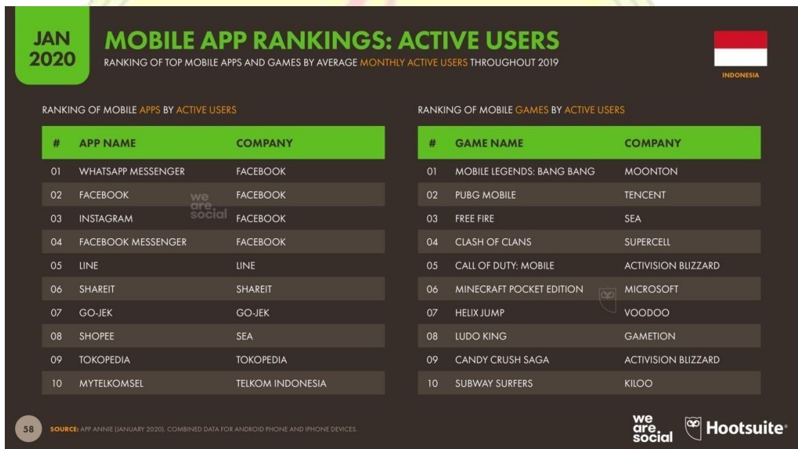
Gambar 1.1 Mobile App Rankings: Active Users

tahun 2020, game Mobile Legends Bang Bang menempati urutan pertama untuk jumlah pengguna aktif bulanan terbanyak di Indonesia. Popularitas Mobile Legends Bang Bang mengalahkan judul-judul populer lainnya seperti Clash of Clans , Free Fire , dan PUBG Mobile .