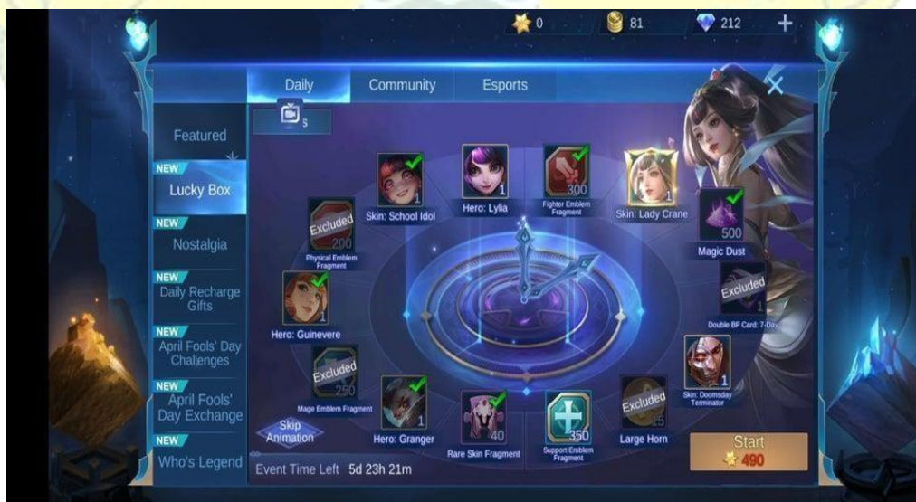
Gambar 1.3 Ilustrasi Lucky Box event

Data tersebut juga memperlihatkan bahwa players Mobile Legend Bang Bang di Indonesia memiliki ketersediaan membayar yang tinggi terhadap barang virtual game online . Namun, dalam praktik penjualan barang dalam game , pihak pengembang Moonton sendiri memiliki sejarah kebijakan yang dapat dikatakan merugikan dan terkesan tidak transparan kepada konsumen. Salah satu permasalahan datang melalui event bulanan khusus Mobile Legends Bang Bang yang diadakan dari game tersebut rilis sampai dengan Juni 2020 silam, event tersebut bernama Lucky Box .