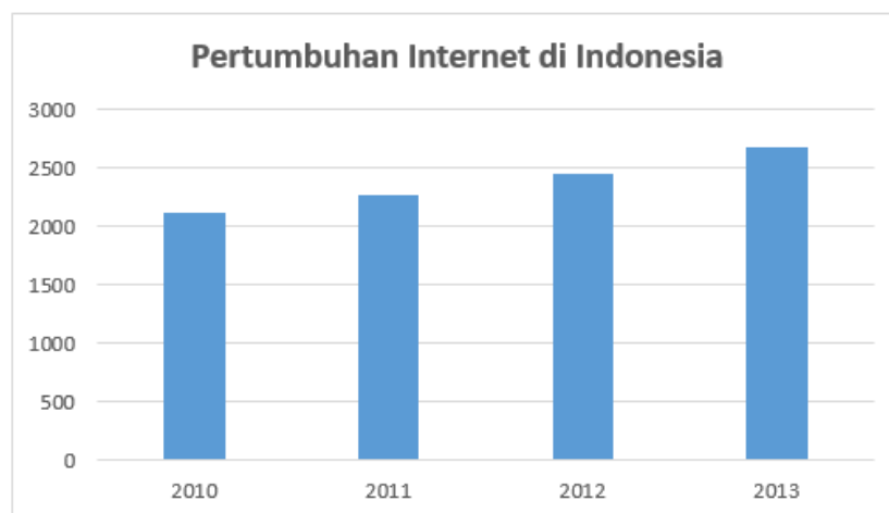
Gambar 1. 1 Pengguna Internet di Indonesia

Perkembangan teknologi internet yang semakin lama semakin mengalami peningkatan, memang tidak dapat dipungkiri dapat menjadi manfaat tidak hanya sekedar untuk menggali informasi, tetapi hal ini juga bisa di jadikan untuk dunia bisnis. Kementerian Komunikasi dan Informatika menuliskan bahwa pada tahun 2017 terdapat 143,26 juta jiwa pengguna internet Indonesia dan hal tersebut setara dengan 54,68 persen dari jumlah penduduk. Sebelumnya pada tahun 2016 pengguna internet di Indonesia adalah 132,7 juta penduduk. Maka, adanya peningkatan yang signifikan dari 2016 ke tahun 2017 sebesar 10,56 juta jiwa penduduk Indonesia. Dan sekitar 48,57 persen pengguna internet di Indonesia adalah wanita, sedangkan 51,43 persen penggunanya adalah pria. Usia terbanyak pengguna internet di Indonesia adalah 13-18 tahun sebanyak 75,50 persen, sedangkan usia 19-34 sekitar 49,52 persen pengguna (Kominfo.go.id, 2018).