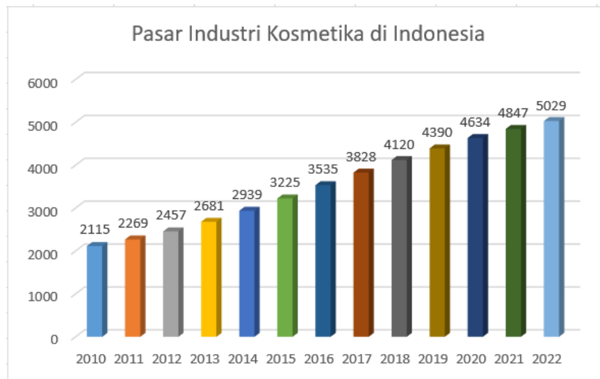
Gambar 1. 2 Tingkat Kosmetika di Indonesia