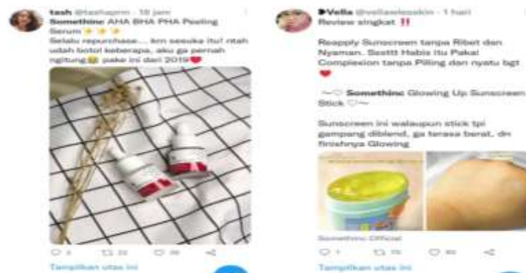
Gambar 1. 6 E-Wom dari pengguna Somethinc

Sosial media Instagram Somehtinc mempunyai 1,3 juta pengikut, yang mana hal ini merupakan Instagram Somethinc mempunyai pengikut terbanyak di antara sosial media Somethinc. Banyak fitur-fitur di Instagram Somethinc yang dapat memudahkan konsumen untuk mencari informasi tanpa menghubungi Somethinc melalui direct message . Somethinc pun sukses merangkul konsumen-konsumennya yang sudah mengikuti dari awal Somethinc muncul di Instagram sejak tahun 2019.