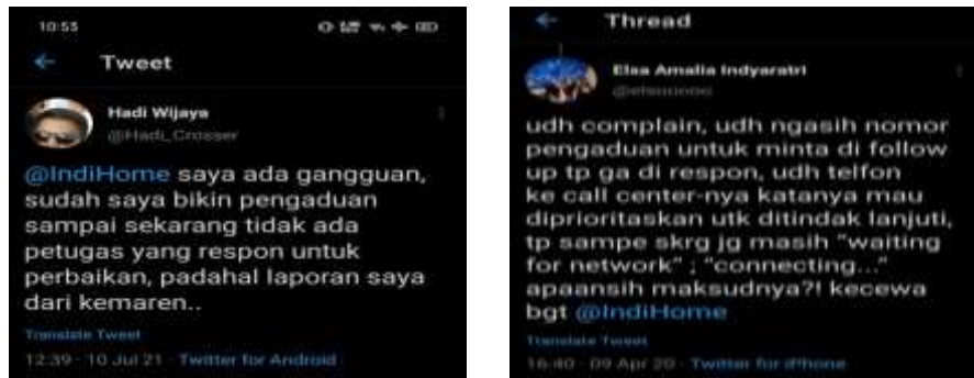
Gambar 1.2 Review pelanggan Indihome terkait kualitas pelayanan

pelanggan. Walau Indihome yang paling banyak digunakan oleh masyarakat, ada beberapa review negatif sebagai berikut: