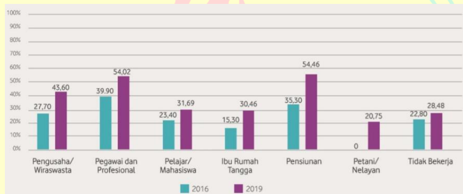
Gambar 1.2 Persentase Literasi Keuangan berdasarkan Jenis Pekerjaan

belum mencapai angka 50%. Selain itu, apabila merujuk dari hasil data indeks literasi keuangan pada tahun 2019 di atas, dapat disimpulkan dan diibaratkan bahwa terdapat sekitar 62 orang penduduk dari 100 orang penduduk yang ada yang masih belum memiliki literasi keuangan yang baik yang mencakup pengetahuan, keyakinan, keterampilan, sikap, dan perilaku yang tepat terkait layanan dan produk lembaga keuangan yang dapat mempengaruhi perilaku menabung masyarakat.