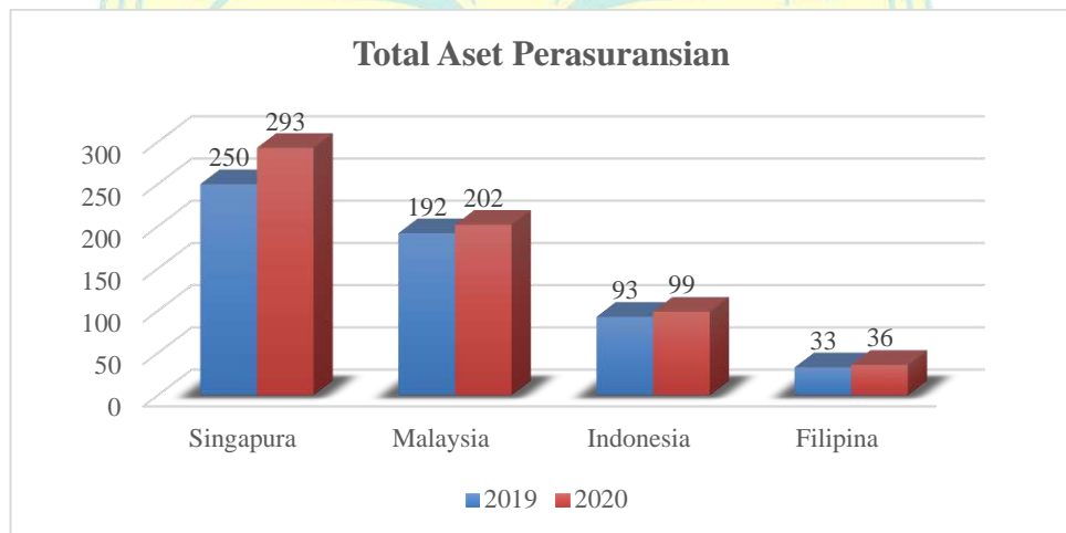
Gambar I.1 Total Aset Perasuransian

salah satu alasan yang mendasari keyakinan tersebut adalah karena potensi pasar domestik masih sangat besar. Berdasarkan data Asosiasi Asuransi Jiwa Indonesia, sampai kuartal 4 tahun 2020 tercatat baru 6,5% masyarakat Indonesia yang sudah memanfaatkan asuransi. Dengan kata lain, terdapat sekitar 90% lebih potensi pasar yang belum tersentuh. Hal itu karena, semakin tinggi tingkat kesadaran masyarakat akan pentingnya memiliki asuransi untuk mendukung kondisi keuangan yang sehat juga menjadi faktor pendukung perkembangan industri perasuransian yang semakin pesat (D. A. Hidayat & Yusniar, 2021).