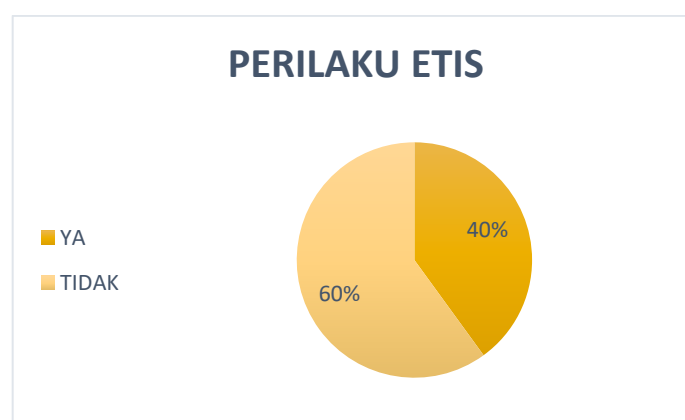
Gambar 1.2 Data Pra Riset Perilaku Etis

Oleh karena itu, untuk mengetahui permasalahan perilaku etis mahasiswa Fakultas Ekonomi Universitas Negeri Jakarta, peneliti melakukan pra riset kepada 30 mahasiswa S1 angkatan 2018 menggunakan angket. Alasan peneliti memilih mahasiswa tersebut sebagai objek penelitian untuk mengetahui permasalahan yang terjadi dalam penerapan perilaku etis mahasiswa terhadap lingkungan di universitas pada masa pandemi covid-19, maupun di masa sebelumnya saat perkuliahan masih dilaksanakan secara tatap muka. Hasil angket yang didapatkan oleh peneliti yaitu sebagai berikut: