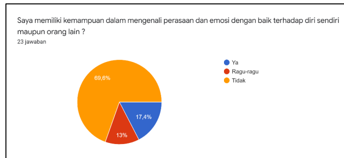
Gambar 1. 4 Survey kecerdasan emosional guru SMK di Bekasi