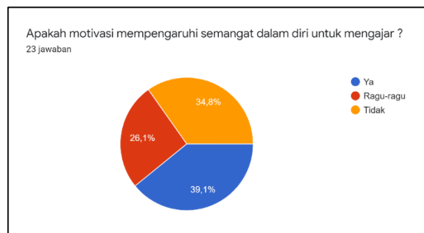
Gambar 1. 3 Survey motivasi guru SMK di Bekasi