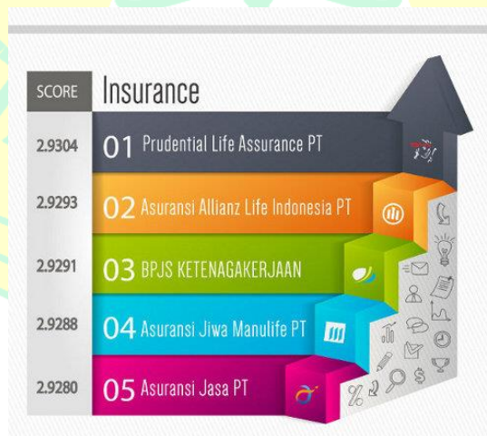
Gambar 1. 1 Hasil Survei Kepuasan Kerja Sektor Asuransi di Indonesia

Dari pernyataan-pernyataan yang telah diuraikan diatas, untuk mengetahui tingkat kepuasan kerja karyawan yang bekerja di sektor asuransi di Indonesia peneliti melakukan pencarian mengenai data survei kepuasan kerja karyawan yang bergerak di sektor asuransi di Indonesia. Berikut adalah hasil pencarian mengenai survei kepuasan kerja karyawan yang bergerak disektor asuransi di Indonesia antara lain: