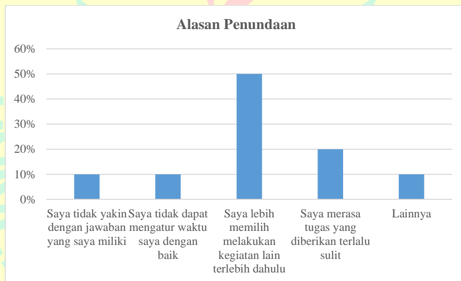
Gambar 1.3 Hasil Pertanyaan Pra-Riset alasan Penundaan

Berdasarkan penyebab dan alasan tersebut, peneliti mengajukan pertanyaan kepada siswa apakah yang menjadi alasan mereka melakukan penundaan untuk melakukan tugas, hal tersebut dapat dilihat pada diagram di bawah: