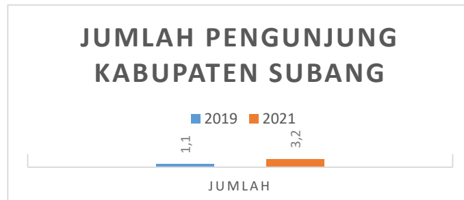
Gambar 1. 2 Jumlah Pengunjung Kabupaten Subang