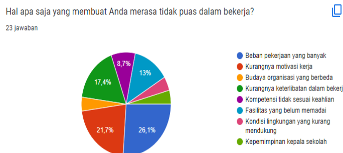
Gambar 1 Hal yang Mempengaruhi Job Satisfaction Guru

Menurut Sabki (2022) dalam CNBC Indonesia menyatakan bahwa terdapat penurunan upah pada lapangan pekerjaan dan mayoritas adalah di sektor pendidikan dengan 6,5%. Kemudian diikuti ekonomi yang terus menurun hingga mencapai angka -1,15% (Saputra 2022). Hal ini dapat berdampak terhadap kepuasan pekerja terutama di bidang pendidikan. Begitu pun job satisfaction yang turut dirasakan oleh guru SMK wilayah Jakarta Pusat dan peneliti melakukan pra riset kepada 23 responden mengenai job satisfaction mereka. Dan hasil yang didapatkan bahwa guru merasa tidak puas dan kurang memiliki kebebasan bekerja dengan persentase 60,9%. Mengenai hal ini, dapat diketahui bahwa masih rendahnya kepuasan kerja terhadap organisasinya. Adapun hal atau faktor yang berpengaruh terhadap job satisfaction guru SMK di wilayah Jakarta Pusat sebagai berikut: