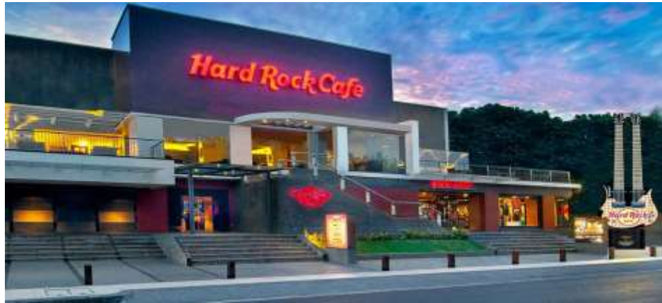
Gambar 1. 2 Hardrock Café Bali di jl. Pantai Kuta Bali