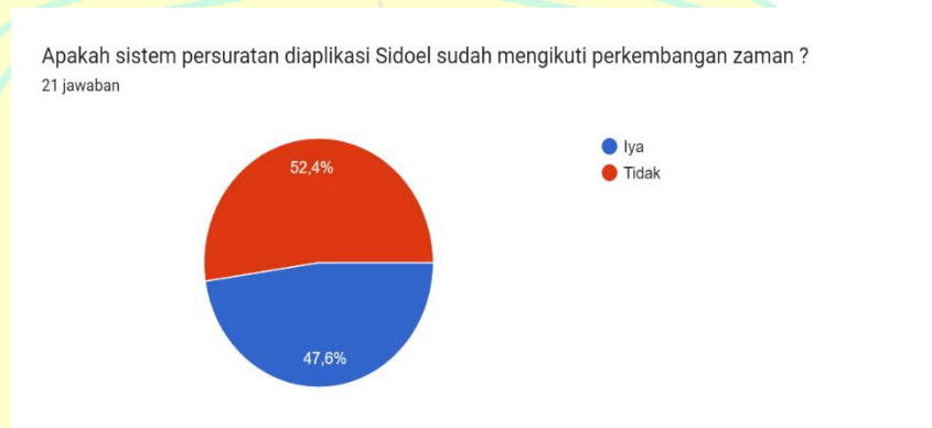
Gambar 1. 3 Data Pra Riset

puas dengan sistem tersebut. Selain itu, peneliti melakukan kuesioner dengan pertanyaan selanjutnya. Hasil dari kuesioner tersebut telah peneliti nyatakan dalam bentuk Gambar seperti dibawah ini.