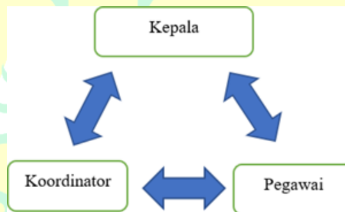
Gambar 3. 1 Triangulasi sumber data

sumber dengan berbagai cara dan berbagai waktu (Riana, Teti Berliani and Agau 2020). Teknik keabsahan data dalam penelitian ini diuji dengan menggunakan triangulasi teknik dan triangulasi sumber. Triangulasi teknik merupakan pengujian data dari sumber data dengan menggunakan teknik yang berbeda, sedangkan triangulasi sumber yaitu melibatkan penggunaan beberapa sumber data yang berbeda untuk melengkapi temuan penelitian (Mustika 2021). Tujuan triangulasi yaitu untuk meningkatkan kekuatan teoritis, metodologis, maupun administrative dari penelitian kualitatif (Mekarisce 2020). Dalam hal ini penulis mengabungkan menjadi satu data observasi, dokumentasi dan hasil wawancara untuk mendapatkan kesimpulan. Seperti dibawah ini :