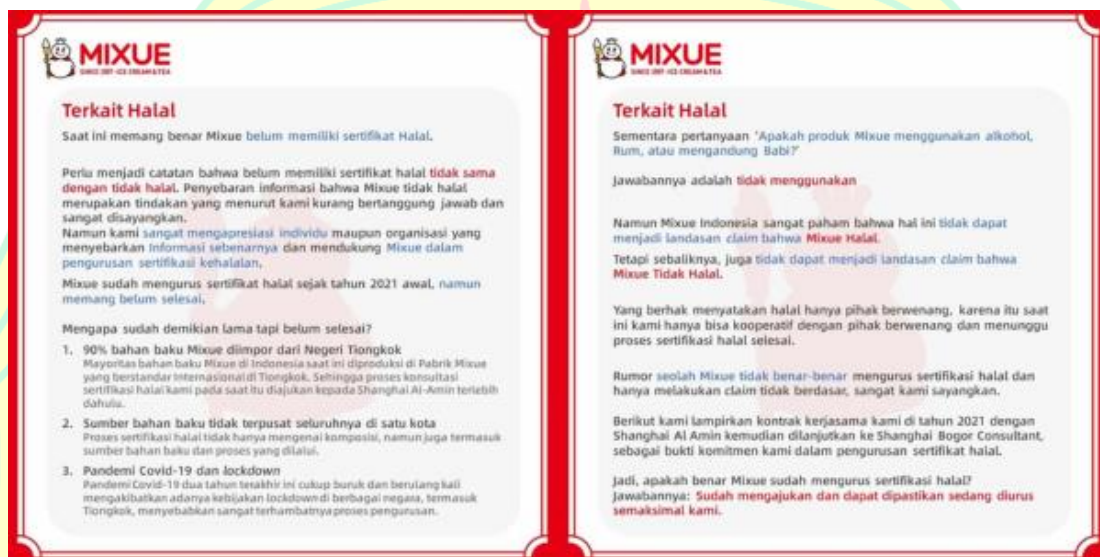
Gambar 1. 3 Masalah Terkait Brand Awareness

yang mampu mengingat dan mengenal suatu produk dalam organisasi atau perusahaan. Banyaknya calon konsumen yang mengingat dan mengenal suatu merek Maka dampaknya bagi perusahaan semakin baik. Mengingat Mixue baru masuk ke Indonesia pada tahun 2020, maka pengetahuan masyarakat soal Mixue masih sedikit dan belum bisa mengingat dengan jelas identitas perusahaan dari Mixue.