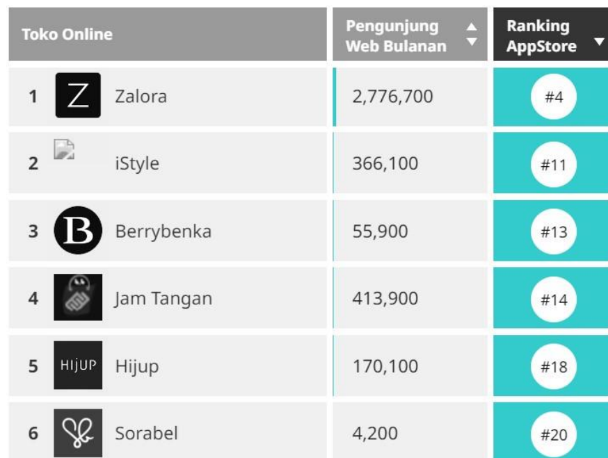
Gambar 1. 2 Persaingan Toko Online di Indonesia

Zalora sendiri adalah e-commerce yang sejak awal diciptakan fokus menjual produk-produk fashion pria, wanita, dan anak-anak. Didirikan pada tahun 2012, Zalora di Indonesia dinaungi oleh PT Fashion Eservices Indonesia. Zalora juga tersebar di beberapa negara lain yakni Malaysia, Filipina, Hong Kong, Taiwan, dan Brunei. Zalora Indonesia menjamin keaslian setiap produk yang ditampilkan di situsnya karena mereka bermitra langsung dengan ratusan jenama lokal maupun internasional yang produknya di jual melalui website maupun aplikasi Zalora (Palupi, 2022).