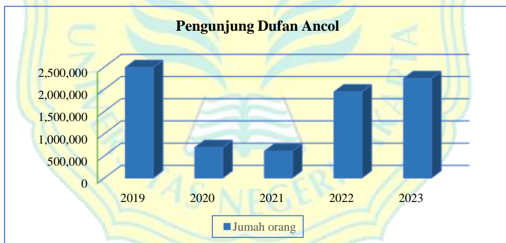
Gambar 1. 4 Jumlah Pengunjung Dufan Ancol 5 Tahun Terakhir

Selain sebagai pusat hiburan outdoor , Dufan juga menjadi area edutainments fisik terbesar di Indonesia. Memberikan pengalaman fantasi keliling dunia bagi pengunjung, taman ini menawarkan sembilan kawasan dengan wahana permainan berteknologi tinggi, meliputi kawasan Jakarta Tempo Dulu, Asia, Eropa, Amerika, Yunani, Hikayat, Kalila, dan Fantasy Lights (ancol.com, 2024).