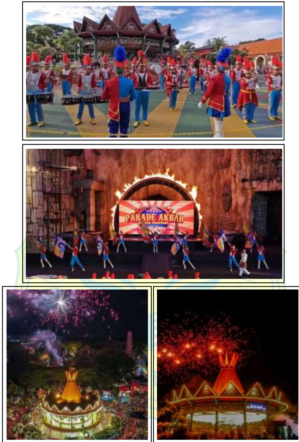
Gambar 1. 5 Pertunjukan Dufan