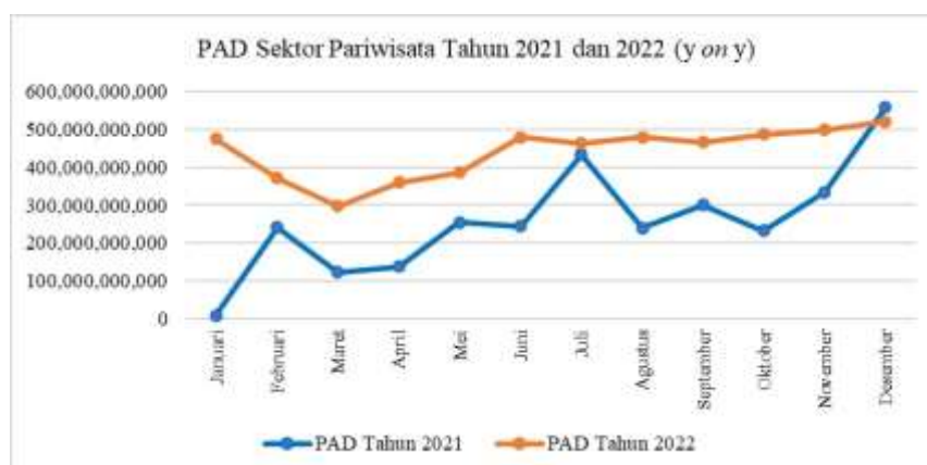
Gambar 1. 2 PAD Sektor Pariwisata Tahun 2021 dan 2022