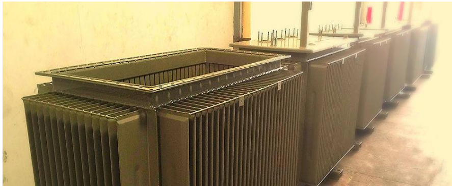
Gambar II.6 Produk berbahan baku sheet metal

melakukan pengecatan produk yang kami hasilkan maupun hanya jasa pengecatan dengan warna yang dapat mengikuti kebutuhan pelanggan dengan kondisi tertentu.