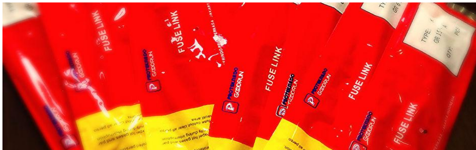
Gambar II.4 Produk Fuse Link

Performa dan karakteristik proteksi dan pemutusan arus dari sebuah fuse cut out sangat tergantung dengan performa dan karakteristik dari fuse link yang terpasang dalam fuse cut out . Kami menggunakan fuse link unit buatan BUSSMAN/ COPPER USA yang telah teruji mutu dan stabilitas karakternya.