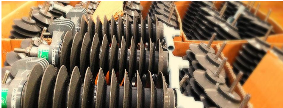
Gambar II.3 Produk Lightning Arrester Class 1

manajemen mutu dan memenuhi/melampaui standar IEC 60099-4 tahun 2009. Produk Proteksindo Goodrun diuji dengan ketat sebelum dinyatakan lulus dan dikirim ke pelanggan.