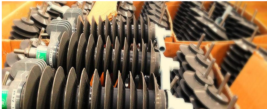
Gambar II.5 Produk Lightning Arrester Class 2

PT. Powerindo Prima Perkasa memproduksi Lightning Arrester Class 2 , mempunyai keunggulan lebih dari Lightning Arrester Class 1 , cocok untuk daerah dengan amplitudo dan frekuensi petir yang tinggi. Dikenal dengan merk dagang Proteksindo Goodrun, sesuai dengan system manajemen mutu dan memenuhi/melampaui standar IEC 60099-4 tahun 2009 dan SPLN D5 006 2013.