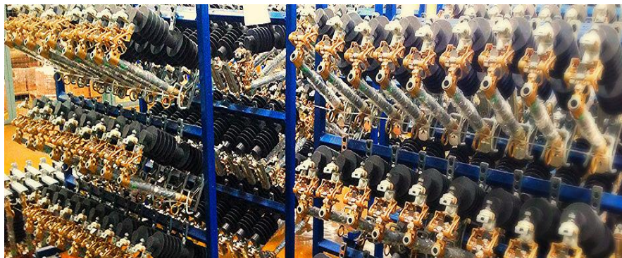
Gambar II.2 Produk Fuse Cut Out

PT. Powerindo Prima Perkasa memproduksi Fuse Cut Out dengan housing dengan bahan dasar Polymer . Dikenal dengan merk dagang Proteksindo Goodrun, sesuai dengan system manajemen mutu dan memenuhi/melampaui standar IEC 60282-2 tahun 2008 dan standar ANSI/IEEE C37.41 tahun 2000. Produk Proteksindo Goodrun diuji dengan ketat sebelum dinyatakan lulus dan dikirim ke pelanggan