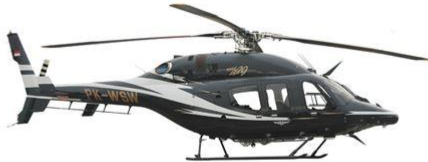
Gambar II.2 PK-WSW