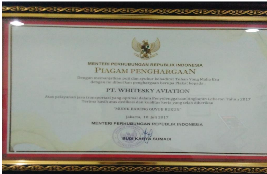
Gambar II.8 Penghargaan yang Diraih PT. Whitesky Aviation

PT. Whitesky Aviation meraih penghargaan atas Pelayanan Jasa Transportasi yang optimal dalam Penyelenggaraan Angkutan Lebaran 2017 “Mudik Bareng Gayab Rukun”