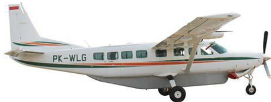
Gambar II.6 PK-WLG