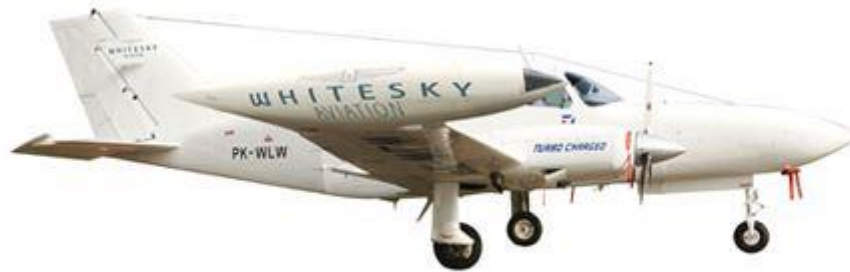
Gambar II.4 PK-WLW

Sumber: http://whitesky.co.id , di akses pada tanggal 22 September 2017