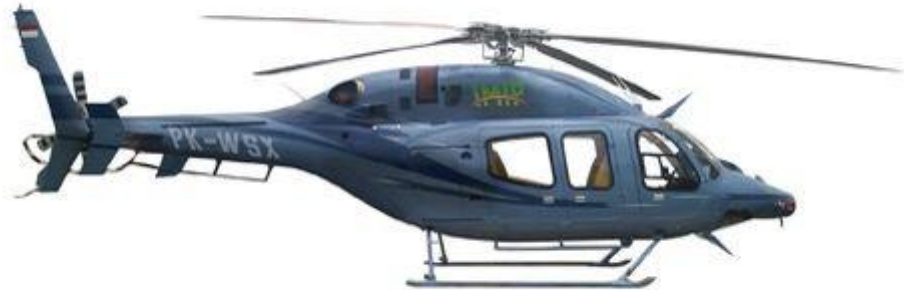
Gambar II.3 PK-WSX