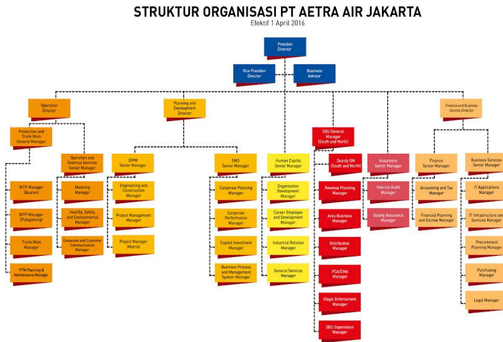
Gambar II. 1