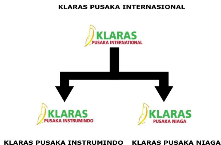
Gambar II.1 Group Structure PT Klaras Pusaka Internasional.