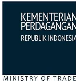
Gambar 1 1 Logo Kementerian Perdagangan Republik Indonesia

Bertepatan dengan Rapat Kerja Kementerian Perdagangan (Kemendag) Tahun 2012 tanggal 7-9 Maret 2012 di Hotel Borobudur Jakarta, Menteri Perdagangan (Mendag) Gita Wirjawan meluncurkan logo serta seragam baru Kementerian Perdagangan.