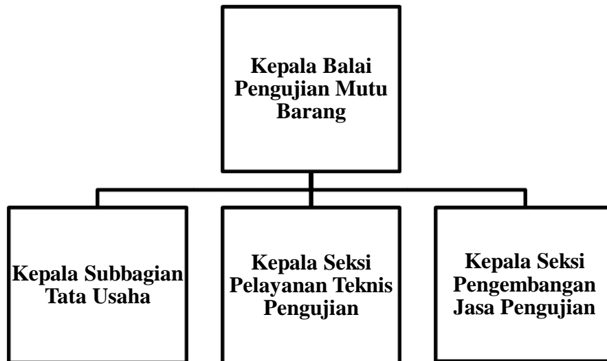
Gambar 1 2 Struktur Organisasi Unit Pelayanan Teknis Balai Pengujian Mutu Barang