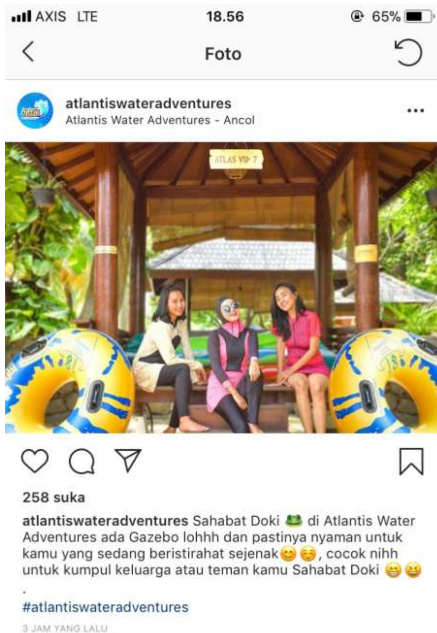
Lampiran 13 Akun Instagram Arlantis Water Adventures untuk Promosi