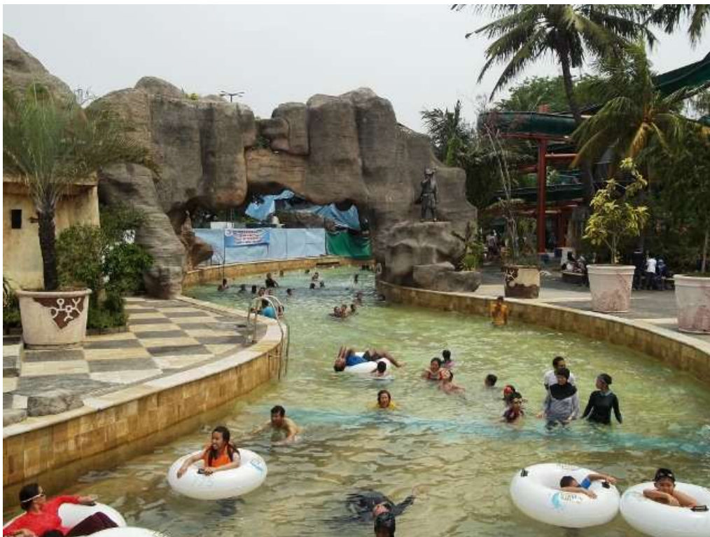
Lampiran 10 Kolam Arus di Atlantis Water Adventures