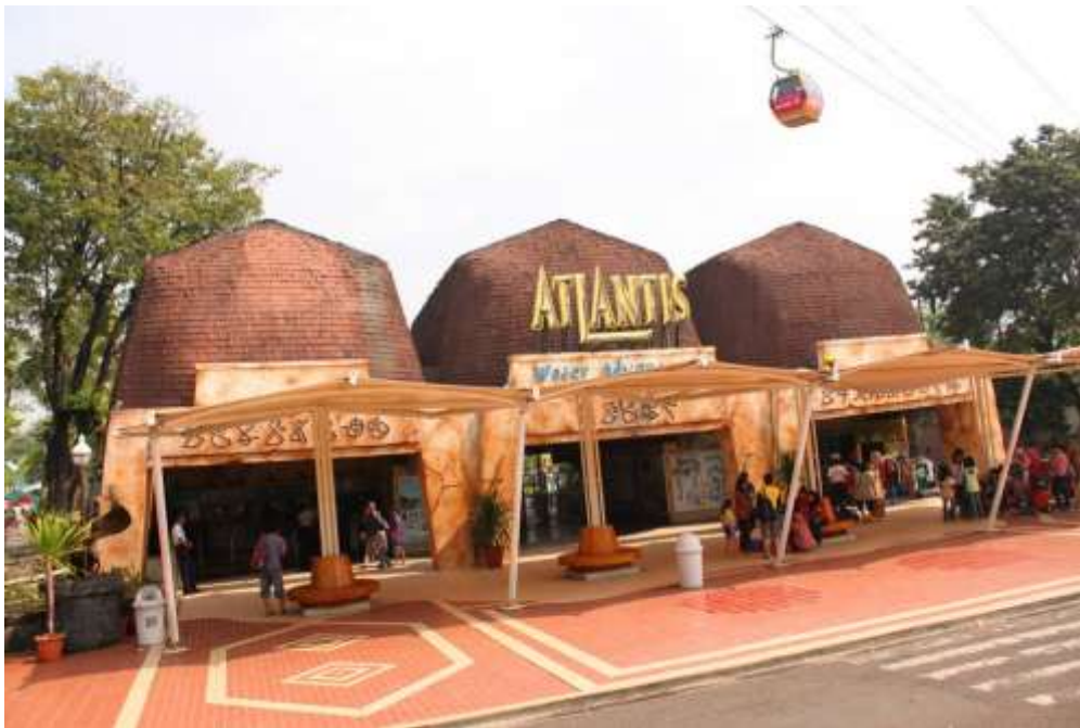
Lampiran 9 Pintu Masuk Atlantis Water Adventures