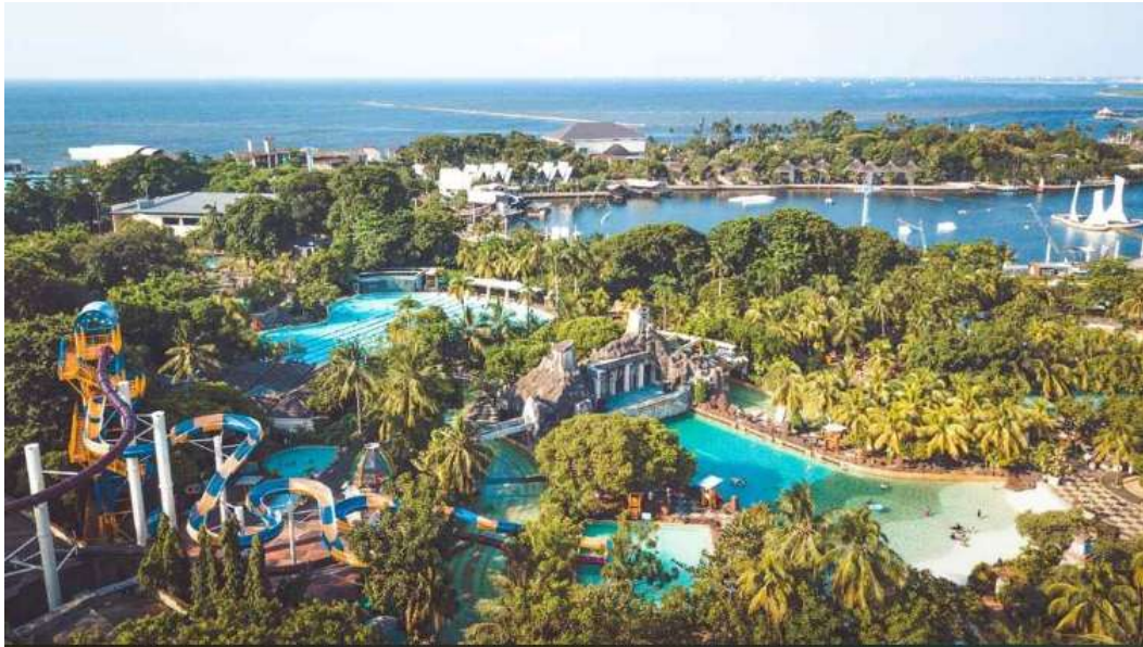
Lampiran 11 Peemandangan Atlantis Water Adventures dari atas