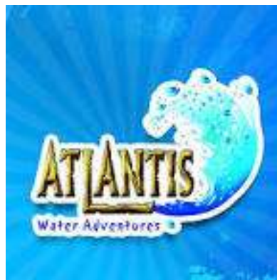
Gambar 1 Logo Perusahaan