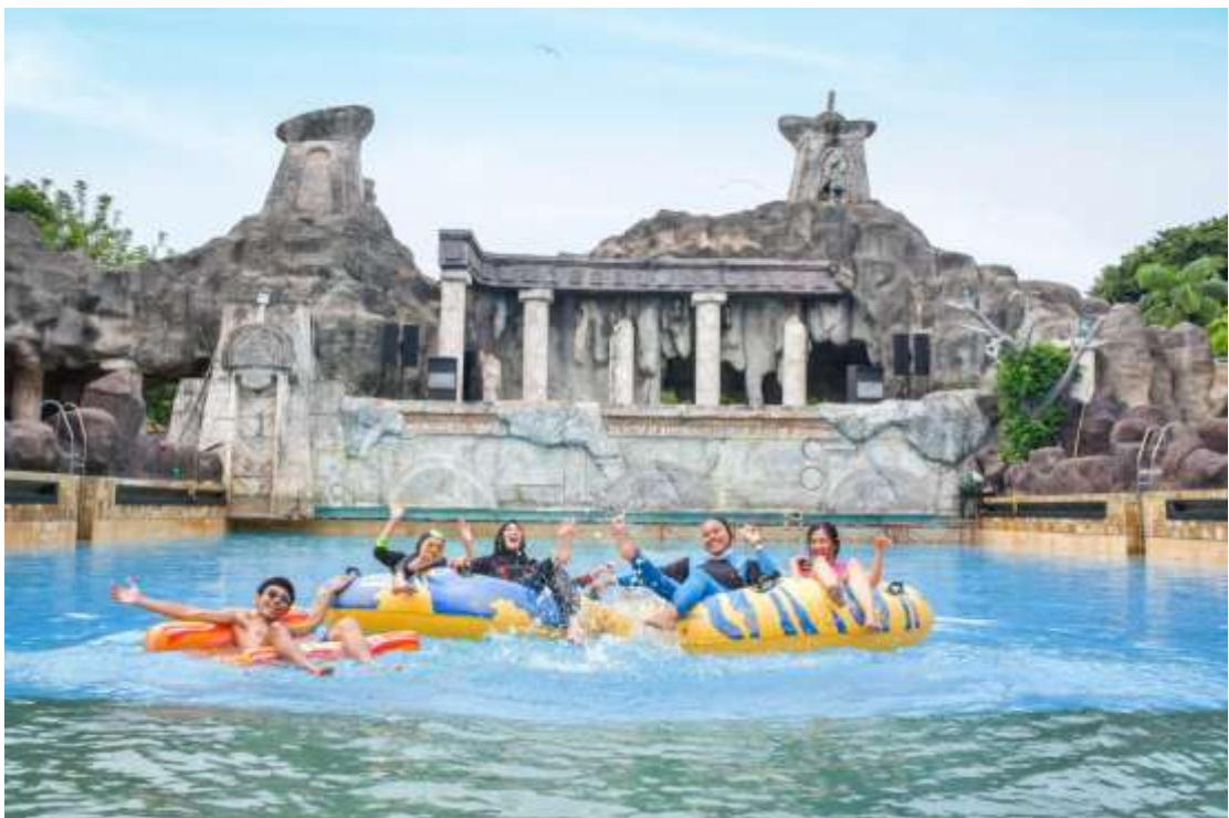
Lampiran 12 Foto Bersama di Kolam Ombak