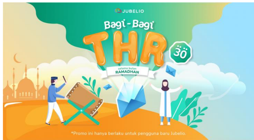
Gambar I.4 Content Marketing Jubelio

Bagi Jubelio, tidak hanya cara memasarkan produk saja yang penting tetapi cara memperlakukan calon customer dan customer tetap nya adalah yang paling penting terhadap keberadaan perusahaan saat ini, maka content marketing dibuat dan didistribusikan ke berbagai jalur media sosial. Berikut merupakan Gambar I.4 yaitu salah satu Content Marketing yang dibuat oleh Jubelio: