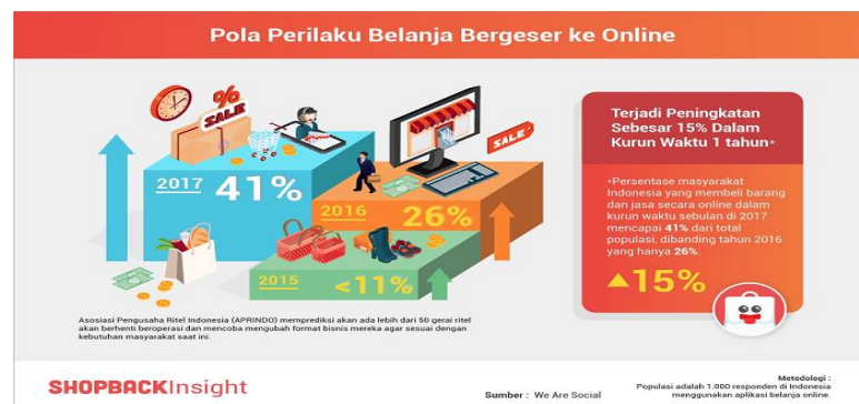
Gambar I.2 Pola Perilaku Belanja Online Di Indonesia

Dengan kemudahan tersebut, terbentuk-lah pola perilaku baru masyarakat dalam berbagai aspek, salah satu nya adalah aspek ekonomi. Masyarakat menemukan bahwa dengan media digital berbasis internet ini, mereka dapat memenuhi seluruh kebutuhan ekonominya, mulai dari mencari informasi produk/jasa yang diinginkan, berkomunikasi online dengan si penjual, berjualan online , hingga berbelanja online . Menurut Indra Yonathan, seorang general manager dari Shopback Indonesia menyebutkan bahwa pada 2017 terjadi peningkatan pola perilaku belanja secara online hingga 41% dari total populasi, naik 15% dari tahun 2016 yang hanya sebesar 26% ( Shopback.co.id , 2018). Rata-rata uang yang dibelanjakan masyarakat Indonesia di situs belanja online seperti Tokopedia, Shopee, Lazada, Zalora, Bukalapak, JD.ID, dll mencapai US$ 228 per orang nya atau sekitar Rp 3,19 juta ( Databoks.katadata.co.id , 2019). Berikut merupakan Gambar I.2 mengenai gambaran statistik peningkatan pola perilaku belanja online di Indonesia: