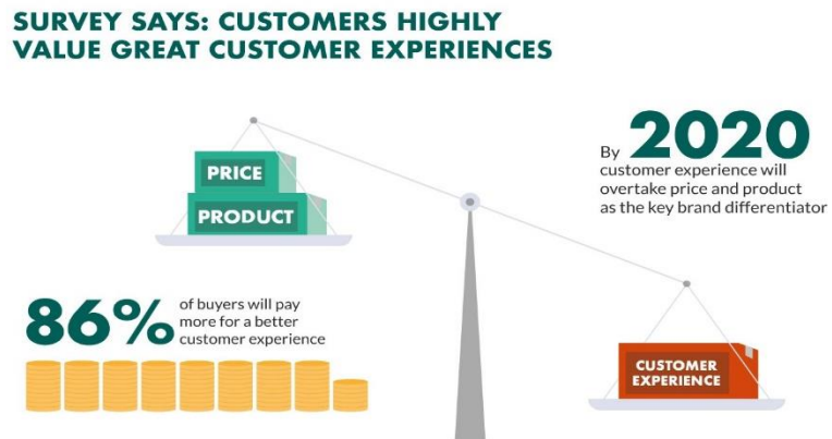
Gambar I.3 Statistik Penting nya Pengalaman Pada Konsumen

experience/pengalaman yang baik pada si konsumen tersebut (superoffice.com, 2020). Berikut merupakan Gambar I.3 Statistik penting nya suatu pengalaman pada konsumen: