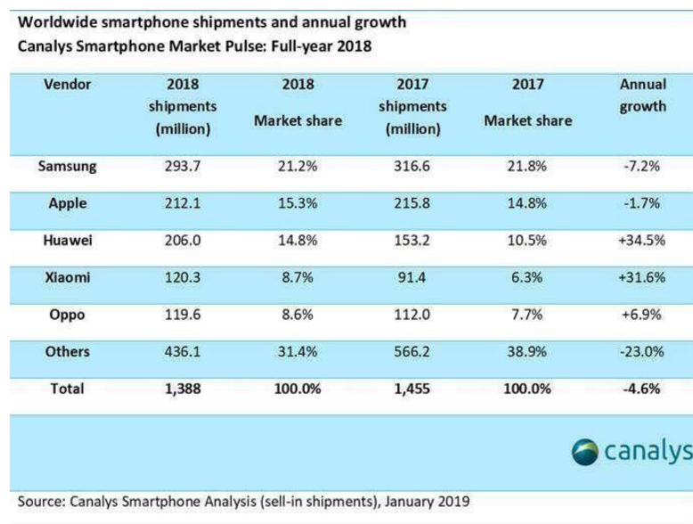
Gambar I. 3 Angka Penjualan Beberapa Merek Handphone

Apple. Untuk pertama kalinya dalam 15 tahun terakhir, sebagaimana dilaporkan BBC, Apple Inc mencatatkan penurunan pendapatan yang cukup tajam pada kuartal ketiga tahun lalu, penyebabnya adalah karena perang dagang. Ini menyebabkan penjualan di wilayah China Raya termasuk Hong Kong dan Taiwan anjlok. ( https://www.cnbcindonesia.com/ )